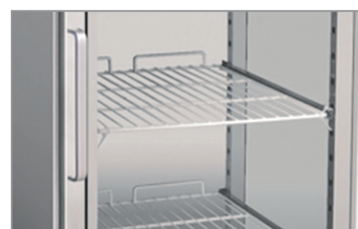
Porte vetro - AX 1500 TNG Glass doors - AX 1500 TNG