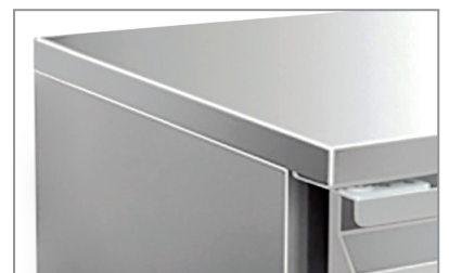
Superficie esterna in acciaio inox Stainless steel body