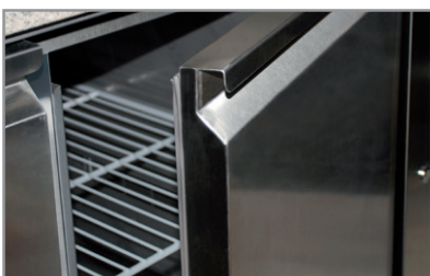
Maniglia integrata Built-in handle