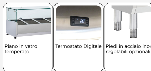
Piano in vetro temperato