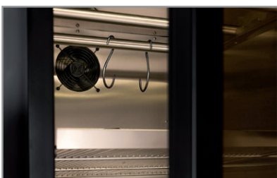
Barre per appendimento Hanging bar