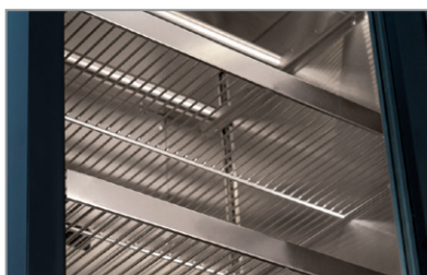
Interni in acciaio AISI 304 Stainless steel AISI 304 interior