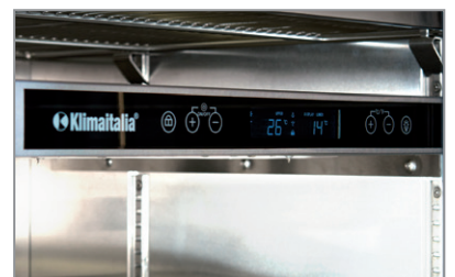
Termostato elettronico touch control Touch control electronic thermostat