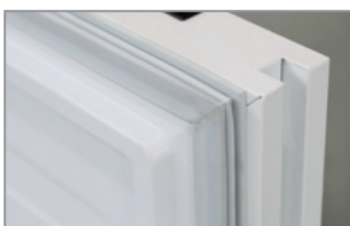
Maniglia integrata Built-in handle