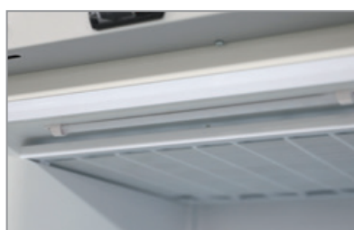
Illuminazione LED LED lighting