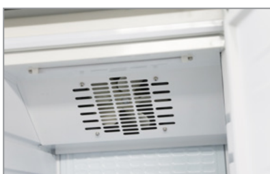
Ventola assiale Axial fan