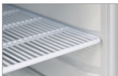
Mensole rinforzate (versione TN) Reinforced shelves (TN model)