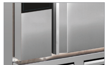
Superficie esterna in acciaio inox AISI 304 AISI 304 stainless steel body