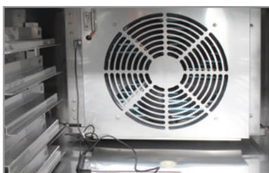
Sonda di raggiungimento temperatura prodotto Product temperature probe