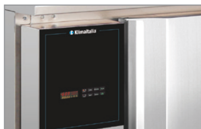
Termostato elettronico con 4 programmi Electronic thermostat equipped with 4 setting programs