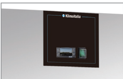
Termostato elettronico Electronic thermostat