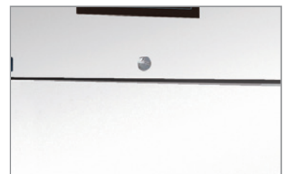
Chiave e serratura Lock and key