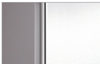
Maniglia integrata Built-in handle