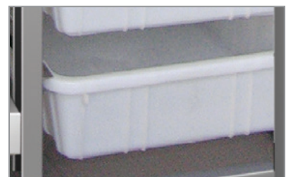
Vaschette in plastica Plastic baskets