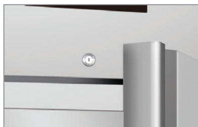
Chiave e serratura Lock and key