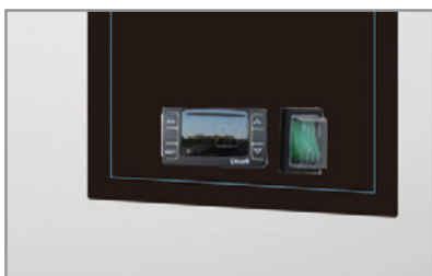
Termostato elettronico Electronic thermostat