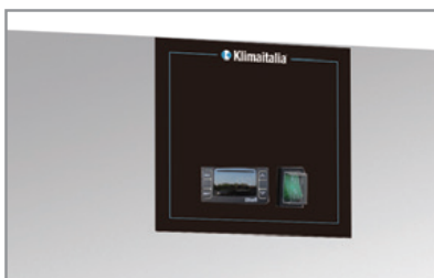
Termostato elettronico Electronic thermostat