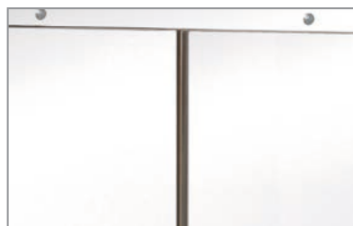
Maniglia integrata Built-in handle