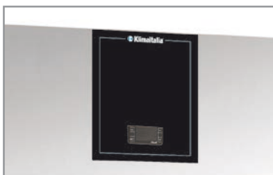
Termostato elettronico Electronic thermostat