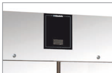
Termostato elettronico Electronic thermostat