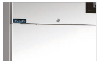
Chiave e serratura Lock and key