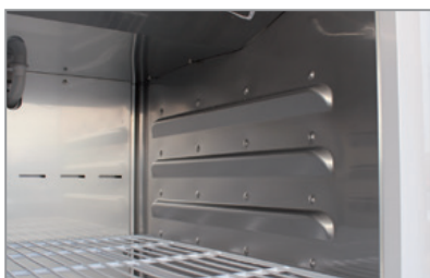
Lamiera interna stampata Thermoformed stainless steel innerliner