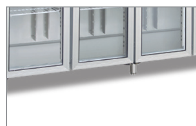
Porte in vetro (Versioni TNG) Glass doors (TNG versions)