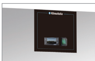
Termostato elettronico Electronic thermostat