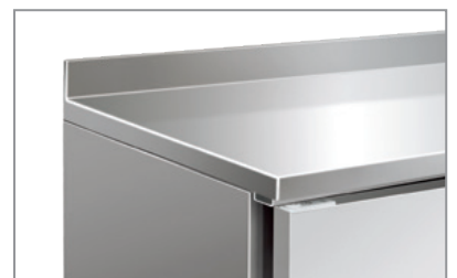
Superficie esterna in acciaio inox Stainless steel body