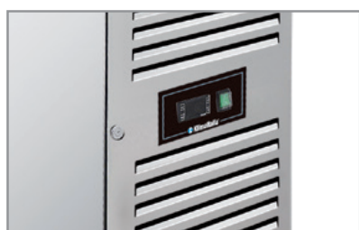
Termostato elettronico Electronic thermostat