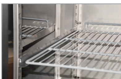
Mensole a scorrimento Sliding shelves