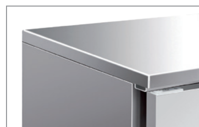
Superficie esterna in acciaio inox Stainless steel body