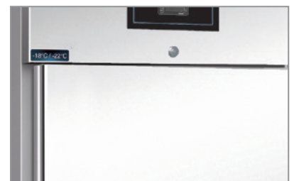
Chiave e serratura Lock and key