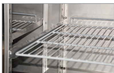
Mensole a scorrimento Sliding shelves