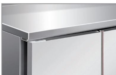
Superficie interna ed esterna acciaio inox Stainless steel body and inner liner